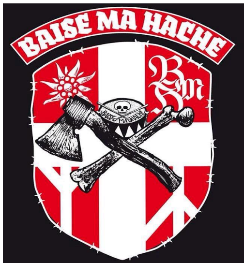
Image reprise des jeunesses hitlériennes, avec le symbole du groupe qui remplace la rune « sowilo », symbole des néo-nazis.